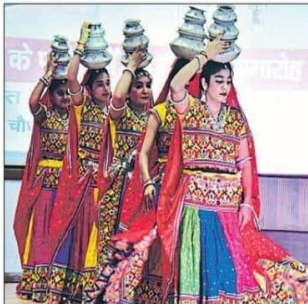
शुक्रवार को सीसीएसयू में हुए कार्यक्रम में सांस्कृतिक प्रस्तुति देती छात्रा।