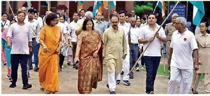
सीसीएसयू में आयोजित काकोरी ट्रेन एक्शन शताब्दी समारोह के उपलक्ष्य में प्रभात फेरी में शामिल कुलपति व अन्य • सौ. सीसीएसयू