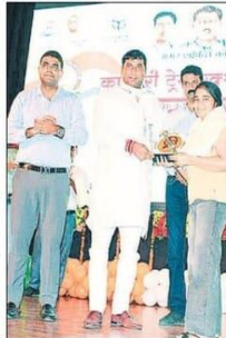
मेडिकल कॉलेज में छात्रा को सम्मानित करते मंत्री।

संग्राम सेनानियों के परिजनों को अंगवस्त्र एवं स्मृति चिन्ह देकर सम्मानित किया। कार्यक्रम में स्कूली छात्र-छात्राओं की ओर से शहीदों के जीवन संघर्ष पर आधारित नाट्य प्रस्तुति दी गई। इस अवसर पर लखनऊ में आयोजित कार्यक्रम का सजीव प्रसारण भी देखा गया। कार्यक्रम के अंत में राष्ट्रध्वज गाया गया। ऊर्जा राज्य मंत्री ने कहा कि प्रधानमंत्री व मुख्यमंत्री के कारण गुमान्य स्वतंत्रता संग्राम सेनानियों को नमन करने का अवसर हम सभी को प्राप्त हुआ है।